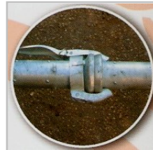
Unión rápida PEROT