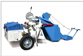
MT89 con tolva y pala