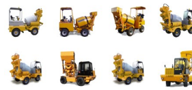
Auto-Hormigoneras Serie DB