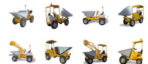
Volquetes Serie DM

Maggiori informazioni? | Más información? | More information?