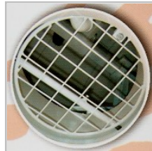
Rejilla de protección del tanque