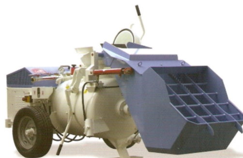
MT89 Mezcladora y transportadora de mortero